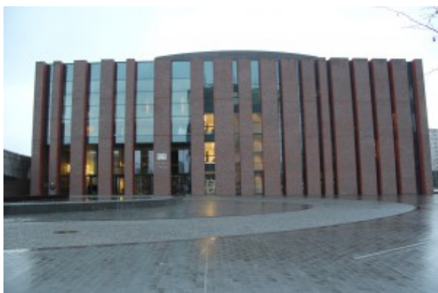
Prvním navštíveným sálem

byly Katovice . Velikánanaský samostatně stojící objekt na místě bývalého dolu na uhlí – opodál ještě stojí jako ozvěna historie těžební stroje. Stavba je zvenčí v podstatě strohá, z červených cihel, nijak extravagantně na sebe neupozorňuje, ale svou velikostí je monumentální. Uvnitř je prostorově velmi štedrá, ani zde není nic extravagantního, je zřejmé, že cílem bylo vytvořit kvalitně fungující konzervativní budovu pro filharmonii (NOSPR). Na někoho