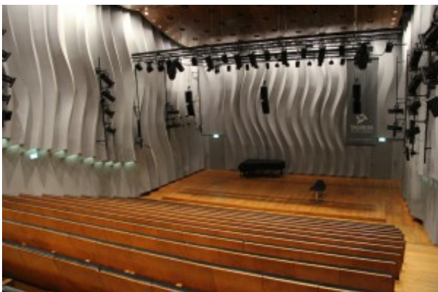
V Katovicích je vnitřní stavba

Domem v domě je samotný koncertní sál – soudobý přístup ke stavbě koncertních sálů spočívá v tom, že samotný prostor pro výkon hudební produkce musí být akusticky co možná nejvíc odizolován, oddělen od vnějšího světa. Dovnitř nesmí proniknout žádné otřesy, ani skrze klimatizaci, žádné zvuky, nic!