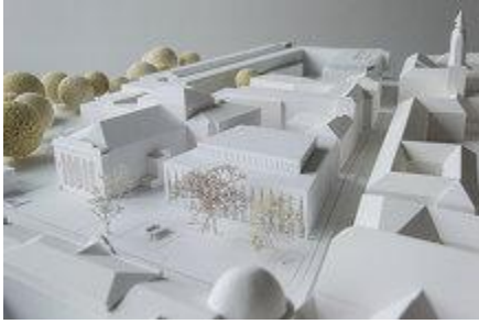
Modellbild 3, Haus der Musik, Barozzi, Veiga 🔍