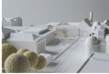
Modellbild 4, Haus der Musik, Barozzi, Veiga 🔍

↓ Plan, Haus der Musik, Barozzi, Veiga (pdf, 5MB)