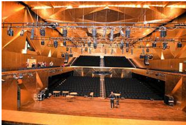
Zicht op zitplaatsen zaal