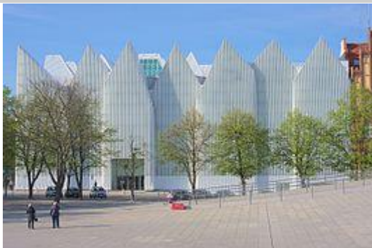
Buitenaanzicht van de Filharmonia