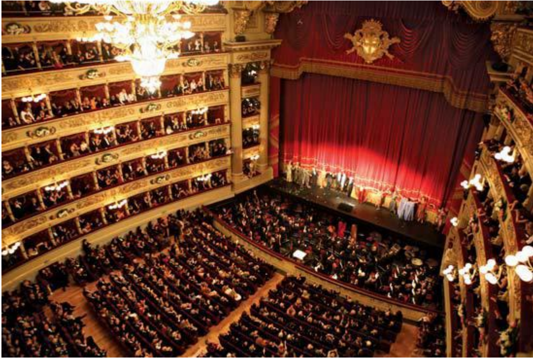
Teatro alla Scala de Milà. Restauració de Mario Botta

Estudiar amb afició. Si no hi posen esperit poc es pot fer.