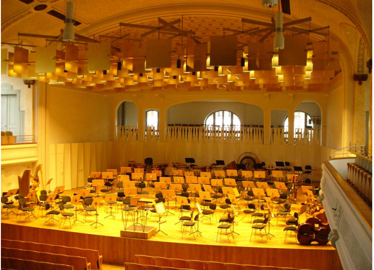
Reforma Auditori Tonhalle St.Gallen a Suisa