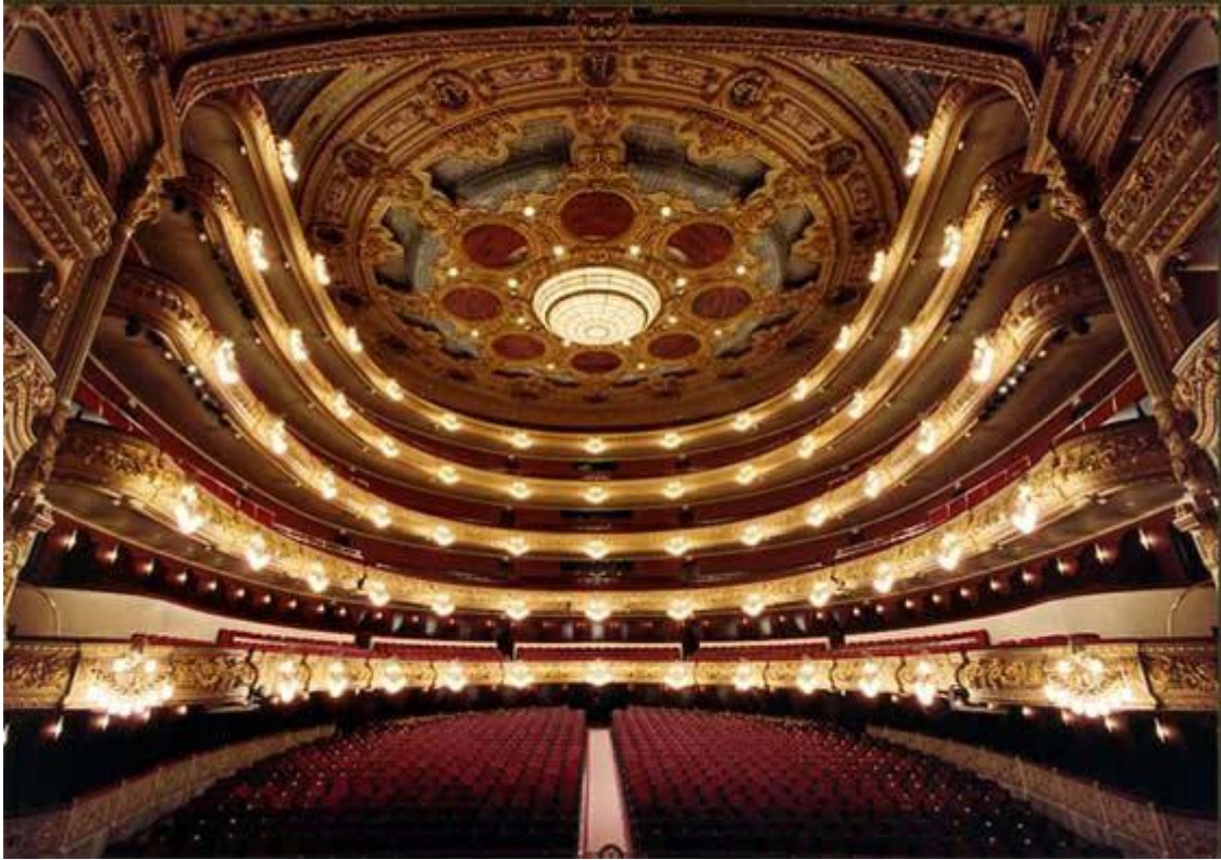
Gran Teatre del liceu Reforma de Ignasi de Solà-Morales, Xavier Fabré i Lluís Dilmé.

Quines son les activitats o projectes que esteu desenvolupant actualment? Algun secret (in)confessable? Que destacaríes d'algun d'ells?