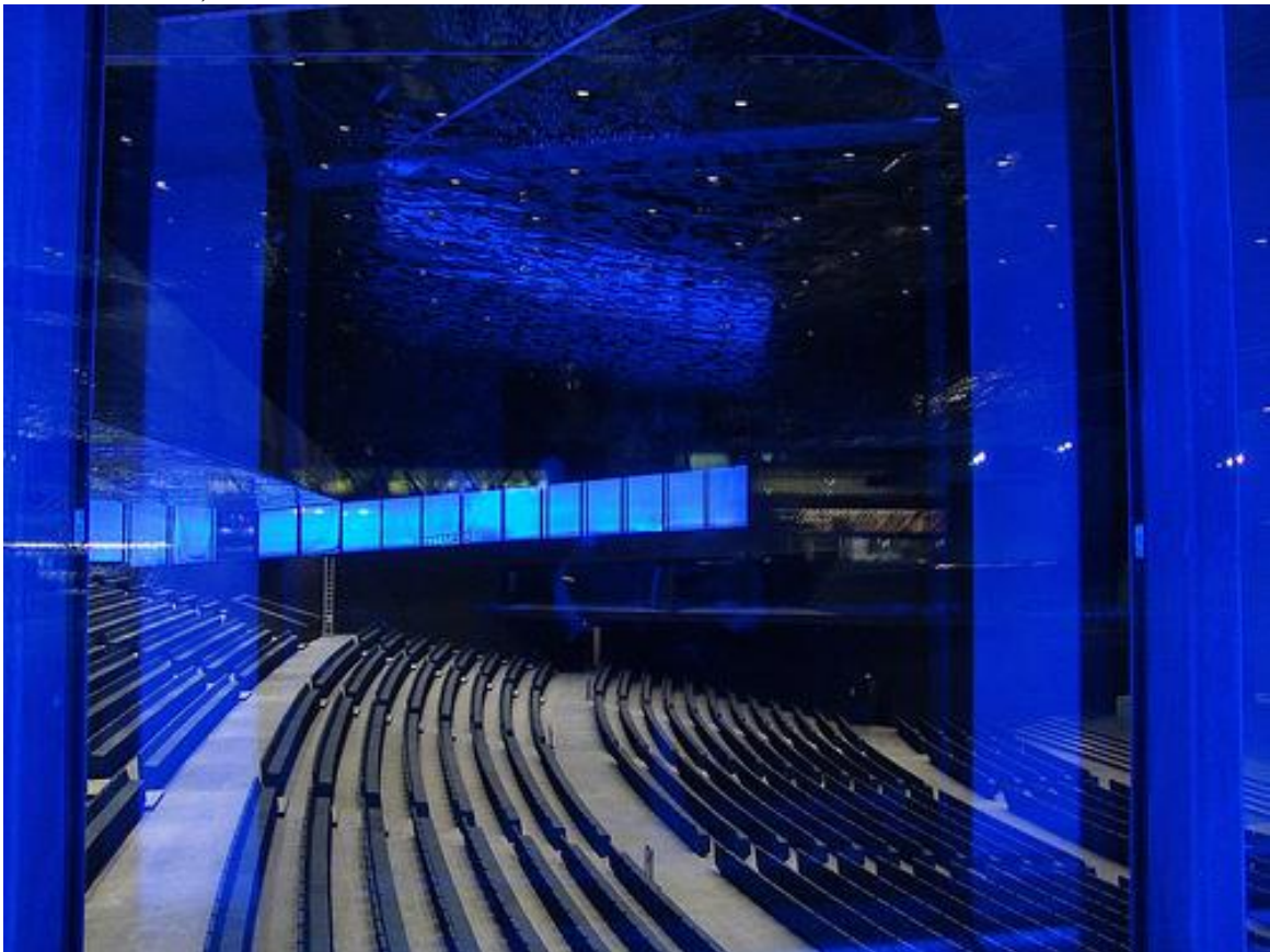
Edificio Fórum arquitectes Herzog & de Meuron