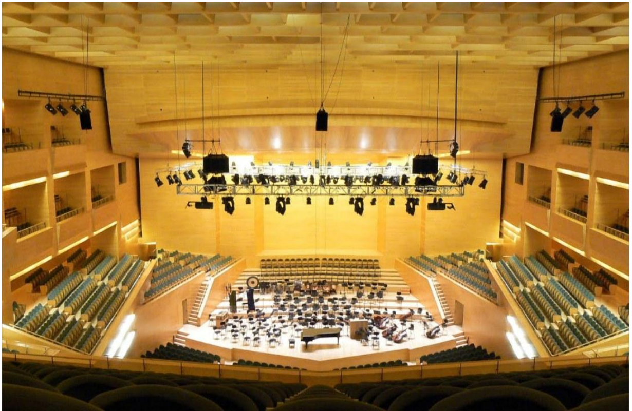
Auditori de Barcelona. Arquitecte Rafael Moneo