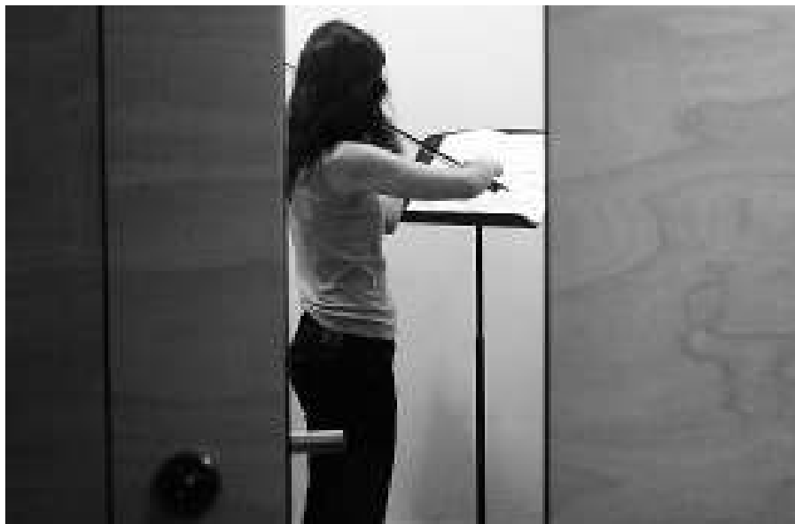
Cabines per assajar. Els estudiants de l'Esmuc, que es dediquen exclusivament a la seva formació musical, tenen a la seva disposició diverses cabines en les quals poden assajar.