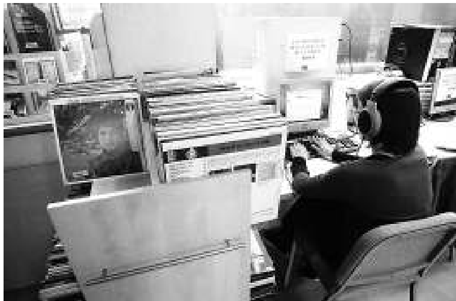
Biblioteca oberta a tots els universitaris. Qualsevol universitari pot accedir a la biblioteca de l'Esmuc, organitzada en funció del tipus de documents més consultats i el fons de la qual s'està digitalitzant.