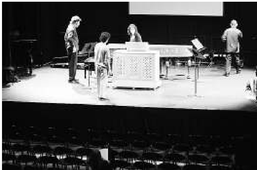
Sala 3 Tete Montoliu. Espai polivalent de 344 m2 amb grada desplegada de 290 m2 i aforament per a 354 persones. S'hi celebren, entre d'altres, els concerts i les activitats dels alumnes de l'Esmuc.