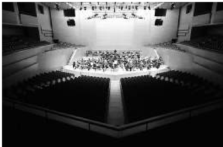
Sala 1 Pau Casals. Entre altres concerts, hi tenen lloc els de l'Orquestra Simfònica de Barcelona i Nacional de Catalunya (OBC). Té un aforament de 2.203 persones i l'escenari fa 160 m2.