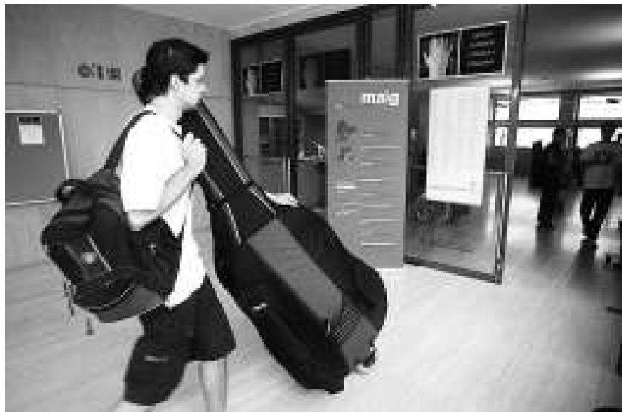
Ambient universitari. A l'Escola Superior de Música de Catalunya (Esmuc) l'ambient és el de qualsevol facultat. En aquest cas, però, a més de motxilles i carpetes, els estudiants porten els seus instruments.