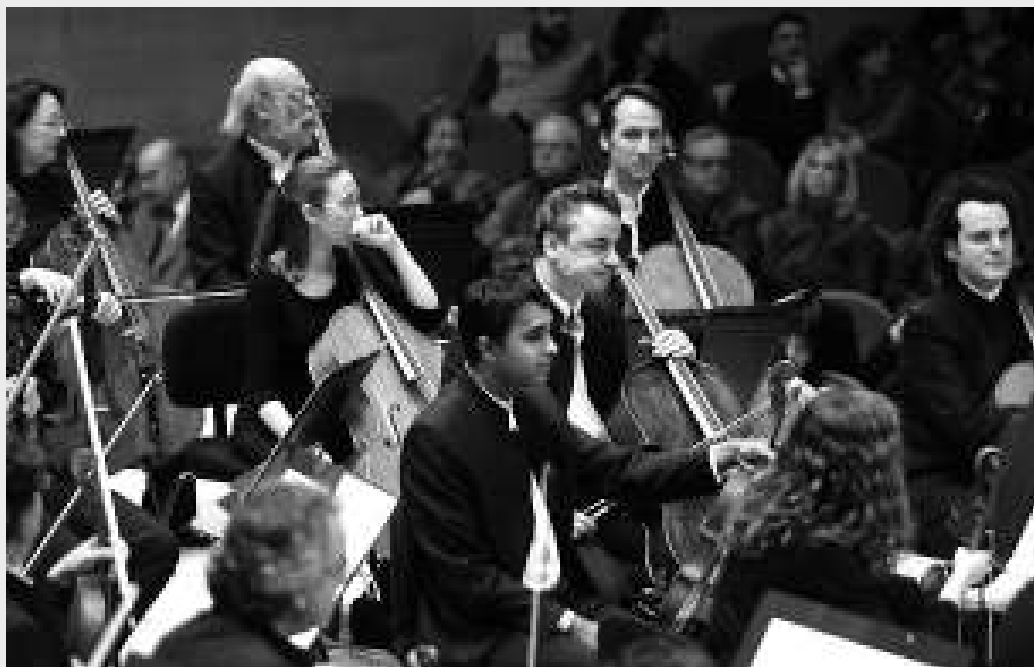
L'Orquestra Simfònica de Barcelona i Nacional de Catalunya (OBC) està formada per un centenar de músics, dirigits actualment per Eiji Oue. Els seus concerts a l'Auditori tenen lloc a la sala 1 Pau Casals. / LL. C.

Des de l'abril del 1999, l'Orquestra de Barcelona i Nacional de Catalunya (OBC), actualment dirigida per Eiji Oue, té la seu de la seva activitat musical a l'Auditori. Joan Oller, director general de l'Auditori i l'OBC, explica la importància de l'OBC per a aquest espai musical de Barcelona: «És la nostra línia principal de programació, tant en pressupost com en nombre de concerts com en personal empleat. Fa uns 90 concerts l'any a l'Auditori, té 12.000 abonats, fet que la converteix en una de les tres o quatre orquestres europees amb més abonats, i anualment assisteixen unes 170.000 persones als seus concerts. És un programa molt important, molt arrelat a la ciutat i al país i que ofereix moltes possibilitats. Cronològicament va ser la primera activitat de l'Auditori i també és la més important des de tots els punts de vista.» Tal com diu