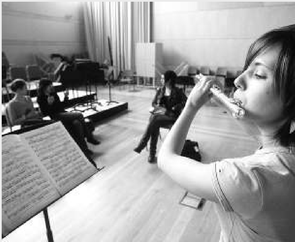
Estudiants de l'Escola Superior de Música de Catalunya (Esmuc) durant una classe.

■ L'Escola Superior de Música de Catalunya (Esmuc), la seu de la qual és a l'Auditori des del 2002, és l'únic centre públic oficial català en el qual s'imparteix el grau superior de música i que atorga una titulació equivalent a la de llicenciat universitari. L'oferta acadèmica de l'escola disposa de deu titulacions: Instruments de la música clàssica i contemporània –que inclou instruments orquestrals i instruments no orquestrals que, al seu torn, inclouen diverses modalitats–, Instruments del jazz i de la música moderna –dins la qual hi ha els itineraris de jazz i música moderna, que al seu torn tenen diverses modalitats–, Instruments de la música antiga –que té diverses modalitats–, Instruments de la música tradicional –dins la qual hi ha instruments de la música tradicional catalana i instruments de flamenc que també tenen diverses modalitats–, Direcció –que inclou les modalitats de direcció de cor i direcció d'orquestra–, Musicologia –que inclou diverses modalitats–, Pedagogia –dins la qual hi ha diverses modalitats–, Composició, Promoció i gestió i Sonologia. Les dues últimes són titulacions pròpies no oficials. L'escola també ofereix cursos d'especialització, màsters i postgraus amb titulació pròpia o en col·laboració amb altres uni-