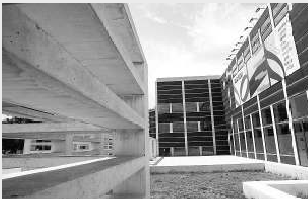
L'edifici de l'Auditori, que es va inaugurar el mes de març de l'any 1999 després de nou anys de construcció, és obra de l'arquitecte Rafael Moneo. Higiní Arau va ser l'encarregat del disseny acústic.

L'edifici té un atri central d'accés, en el qual s'ha construït una monumental llanterna cúbica de vidre en forma d'impluvi, decorada amb pintures ratllades de Pablo Palazuelo, i disposa de tres sales de concerts—sala 1 Pau Casals, sala 2 Oriol Martorell i sala 3 Tete Montoliu—, l'acústica de les quals ha estat minuciosament estudiada dins el projecte per l'enginyer especialitzat Higiní Arau. Així, la sala 1 Pau Ca-