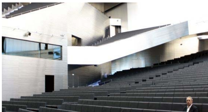
Vázquez Consuegra, en el auditorio del Palacio de Congresos.

Archivado en: Guillermo Vázquez Consuegra Auditorios Bienal Flamenco Inauguración obras Arquitectos Sevilla Arquitectura civil Edificios singulares Arquitectura Andalucía España Arte Obras públicas Urbanismo Cultura Sociedad