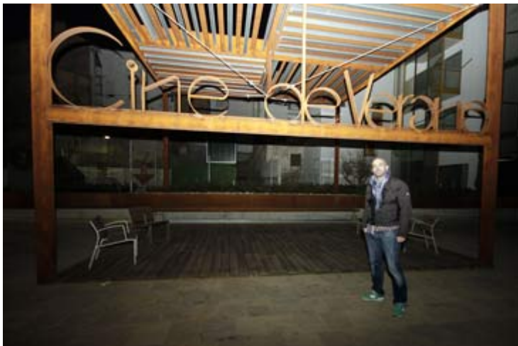
Las instalaciones ofertarán cine de verano