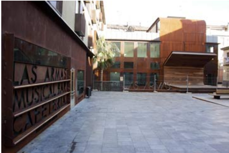
Las instalaciones se inaugurarán en junio de 2012

R.- La gestión es privada, pero aquí estamos abiertos a todos. No cerramos las puertas a nadie. Todo el mundo que quiera aportar algo o colaborar de una forma u otra podrá hacerlo. Estamos abiertos a escuchar cualquier propuesta artística.