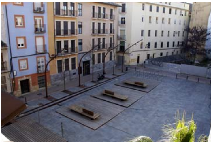
Vista aérea del patio del Centro de Las Armas

Ayuntamiento nos cederá musicales y de filmoteca que tiene guardados para que la gente los pueda ver y disfrutar.