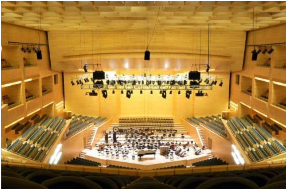
Auditori de Barcelona. Arquitecte Rafael Moneo