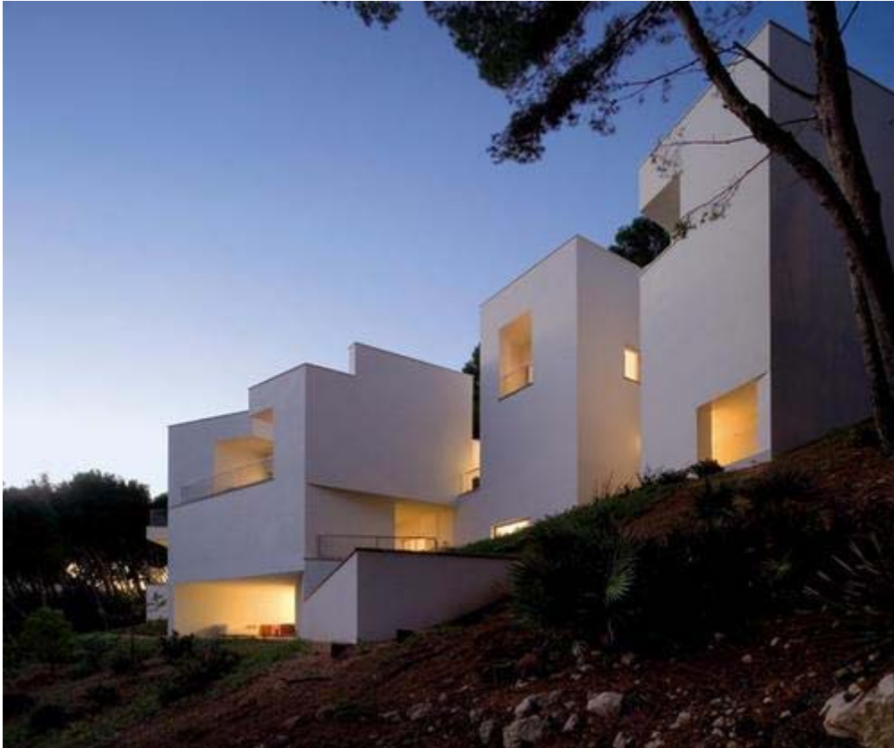
Casa a Formentor, Mallorca. Álvaro Siza