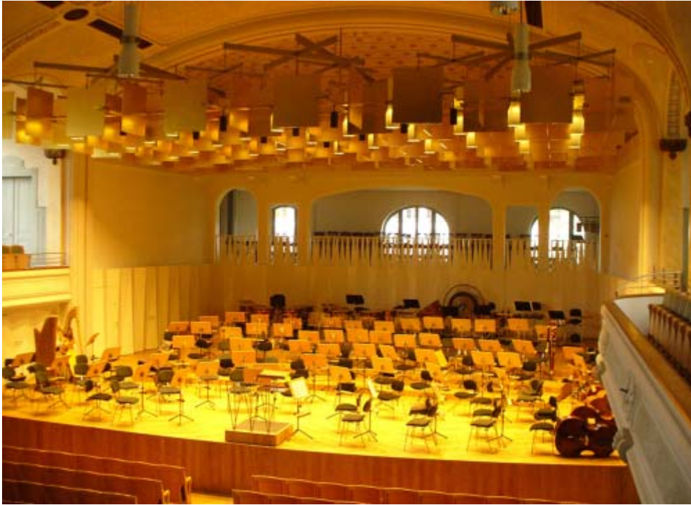
Reforma Auditori Tonhalle St.Gallen a Suisa