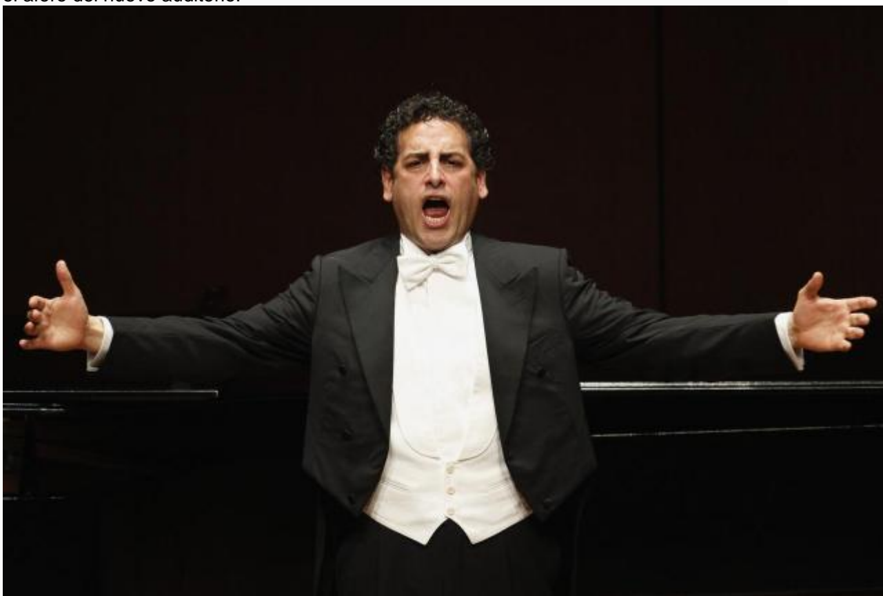
Juan Diego Flórez inaugura mañana el Palacio de Congresos de Fuerteventura

Las Palmas de Gran Canaria, 7 ene (EFE). - El tenor Juan Diego Flórez inaugurará mañana el Palacio de Congresos de Fuerteventura, que este año acoge el primer concierto del XXXI Festival de Música de Canarias , que podrá ser seguido por 1.262 espectadores, el aforo del nuevo auditorio.