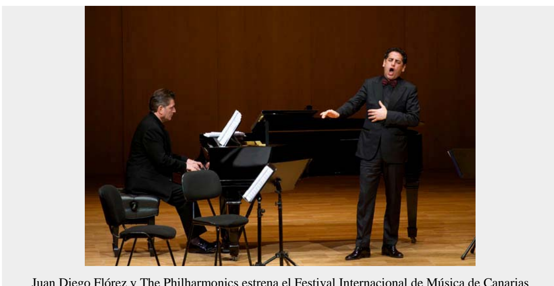
Juan Diego Flórez y The Philharmonics estrena el Festival Internacional de Música de Canarias

La nueva sala de conciertos conquistó también a técnicos y público en el estreno en la Isla del Festival Internacional de Música de Canarias