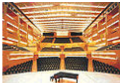
Sala 1-Pau Casals