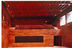
Revestimiento en madera de Okume