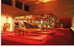
Museo de la Música