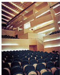
Detalle Sala 1